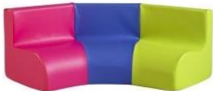
banquettes ou fauteuils