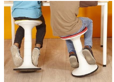
tabouret « culbuto »

➤ Les assises dites calmantes offrent une faible amplitude de mouvement et permettent :