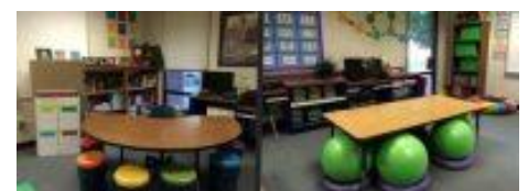
Tables moyennes avec poufs ou ballons