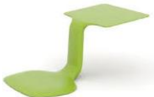
Assise avec support tablette