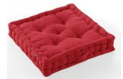
Poufs et coussins

➔ Limites : certaines assises peuvent générer du bruit, il peut y avoir des bavardages au moment des transitions.